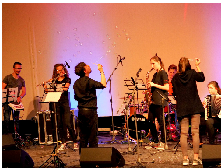
EIAPUF, DK Ružinov