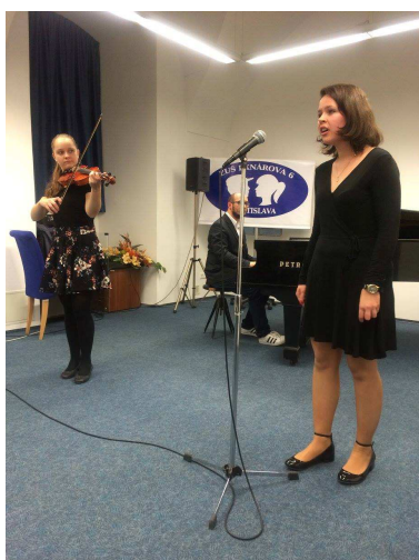
Adventný koncert, Seminárna sála Univerzitnej knižnice