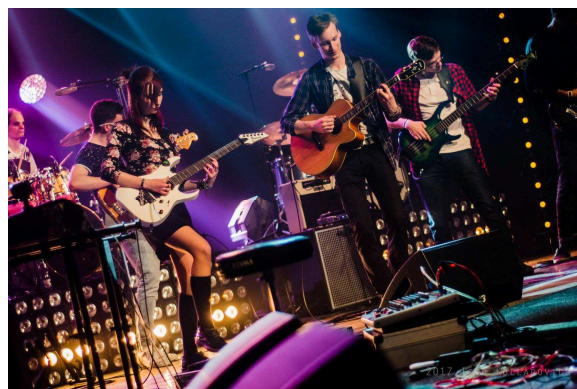
10. rokov RockKids (koncert k 10. Výročiu založenia, Veľká sála DK Ružinov)

Záznam reportáže z koncertu (stlač Ctrl a Klikni tu )