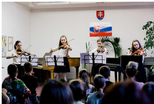
Interný koncert v Koncertnej sále školy