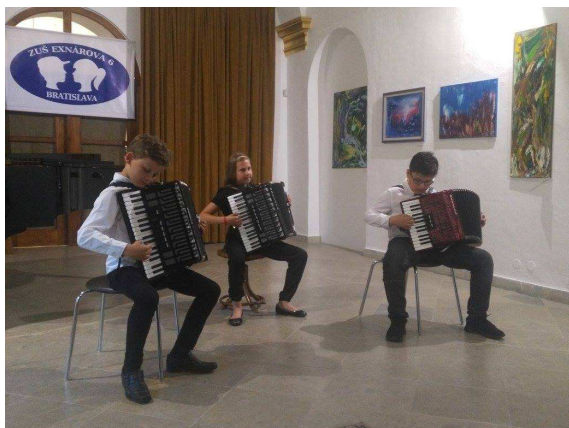
2. Závěrečný koncert, Pálffyho palác